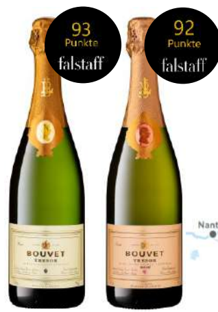
Trésor Saumur Brut Blanc & Rosé Unv. Empf. EVP 18,95€