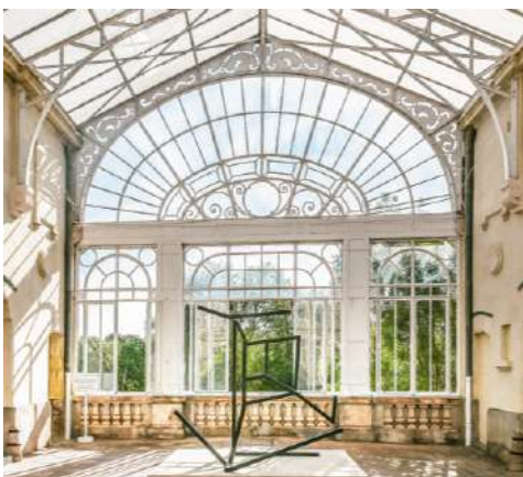
Zentrum für zeitgenössische Kunst