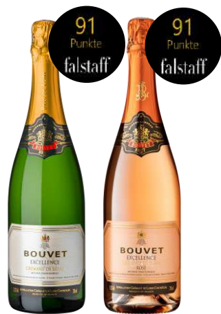
Excellence Crémant de Loire Brut blanc & Rosé Unv. Empf. EVP 14,95€

Die Geschichte von Bouvet Ladubay beginnt 1851 mit der Vision von Étienne Bouvet und Célestine Ladubay. Mit dem Erwerb der kilometerlangen Tuffsteinkeller in Saumur legen sie den Grundstein für ein Schaumweinhaus mit internationalem Anspruch. Seit 1932 liegt Bouvet Ladubay in den Händen der Familie Monmousseau. Die aus der Region stammende Familie ist bereits seit dem Ende des 19. Jahrhunderts als Weinproduzent im Loire-Tal tätig und eng mit der Geschichte und Entwicklung des regionalen Weinbaus verbunden. Heute führt Juliette Monmousseau das Haus in vierter Generation und verbindet die gewachsene Tradition des Familienunternehmens mit moderner Kellertechnik sowie einem klaren Bekenntnis zu Kultur, regionaler Verwurzelung und nachhaltiger Arbeitsweise.